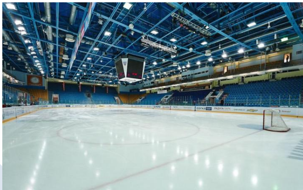
Строительство ледовой арены